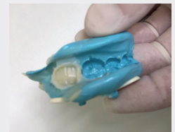
2 Vue dans l'empreinte.