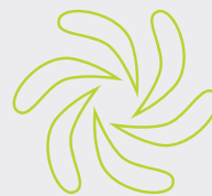
Hélice Restaurations antérieures